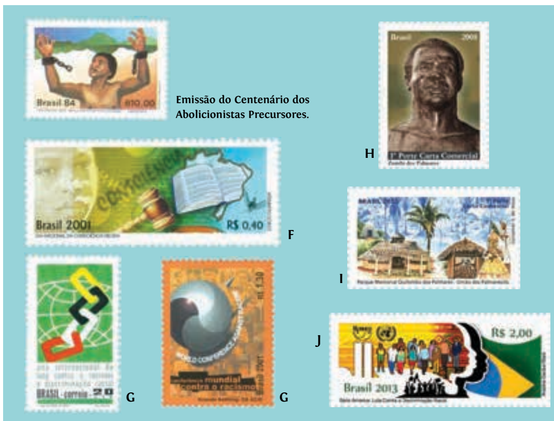
Emissão do Centenário dos Abolicionistas Precusores.

em 2001 e possuem Editais assinados pela Secretaria de Estado dos Direitos Humanos do Ministério da Justiça. Isso demonstra como a questão já estava em voga nas esferas governamentais. (Imagem “G”, acima).