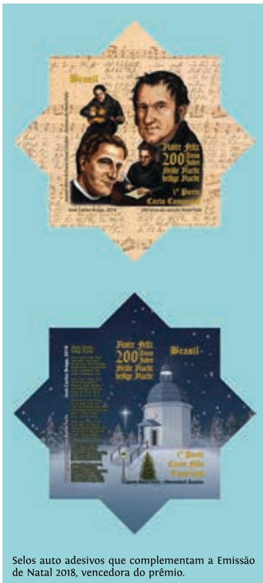
Selos auto adesivos que complementam a Emissão de Natal 2018, vencedora do prêmio.