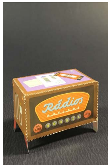
Foto do rádio montado com os selos do bloco.

Hoje o rádio está presente na web e as transmissões analógicas de ondas médias e curtas tendem a desaparecer. Atualmente se usam cada vez mais meios digitais para transmitir música e informação. Mas nem sempre foi assim. Com essa emissão os Correios registram a evolução dos antigos receptores de rádio, que atualmente são objetos veneráveis e silenciosos expostos em museus, uma tecnologia nostálgica e romântica para os que viveram a época que tanto colaborou para o progresso da humanidade. O bloco é composto por quatro selos e foi idealizado para ser uma dobradura de papel, na forma de um rádio valvulado. Cada selo representa aspectos distintos do motivo – tecnologia, notação eletrônica, estética do equipamento e funcionamento. O miniaparelho de rádio pode ser montado com uso de tesoura, cola (ou mesmo a goma do selo) e o próprio picote dos selos, constituindo uma metáfora para a prática do radioamadorismo, e sua tradição de montagem de equipamentos eletrônicos. A paleta de cores faz referência aos antigos aparelhos de rádio, com uso de tons que remetem à madeira e metal. Foram utilizados recursos especiais de impressão: aplicação de verniz localizado, relevo seco e tinta calcográfica. Arte criada com técnicas mistas de ilustração vetorial.