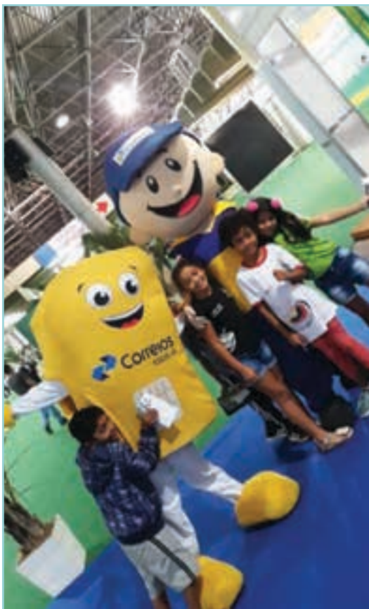
O Carteirito e o Chipito fizeram a alegria da criançada.