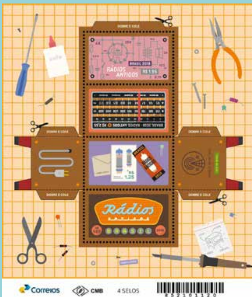
Bloco da Emissão Rádios Antigos. Autoria de Fabio Lopez.