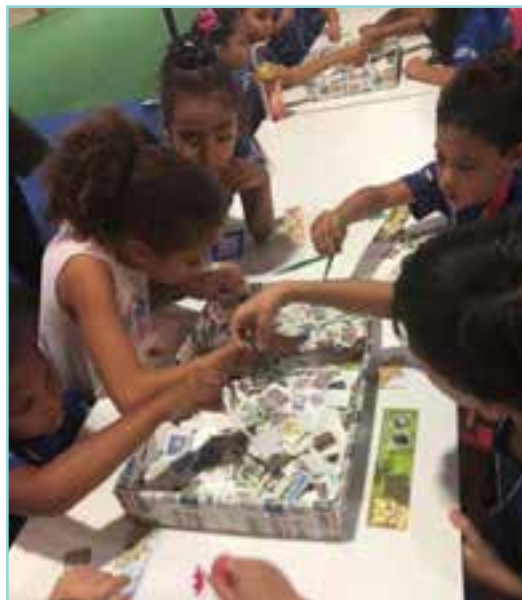
As oficinas atraíram mais de 3 mil participantes, a maioria crianças.

Você deve estar se perguntando o porquê de uma oficina filatélica na Semana. Muitas emissões filatélicas homenageiam cientistas e contam a história das grandes invenções, sem falar na tecnologia envolvida na produção de selos, desde formatos diferentes, aplicação de tintas especiais e aromas. Isso mesmo, tem selo com cheiro e até sabor.