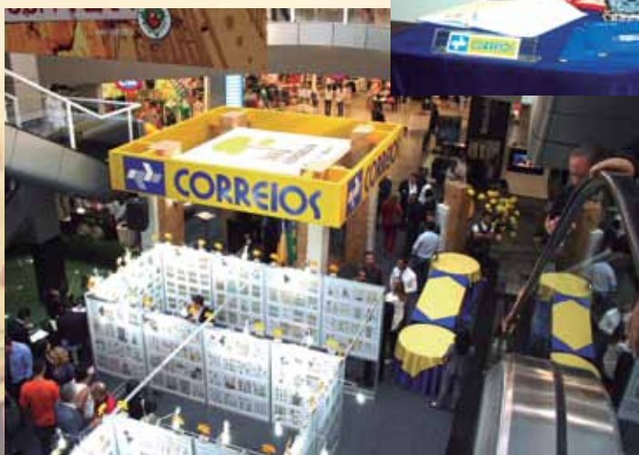
Vista panorâmica da EXPOSELOS, realizada no Flamboyant Shopping Center, em Goiânia.

Várias exposições foram destaque nesta edição, como a mostra “Troféu Olho-de-Boi”, que apresentou os melhores selos dos últimos anos, e a exposição “Selos Postais: Arte, Técnica e Percepção”, que teve como objetivo principal divulgar as técnicas impressas nos selos, despertando e aguçando os sentidos humanos. Também foi realizada a entrega do “Troféu Olho-de-Boi 2009”, como prêmio do concurso Melhor Selo do Ano. ■