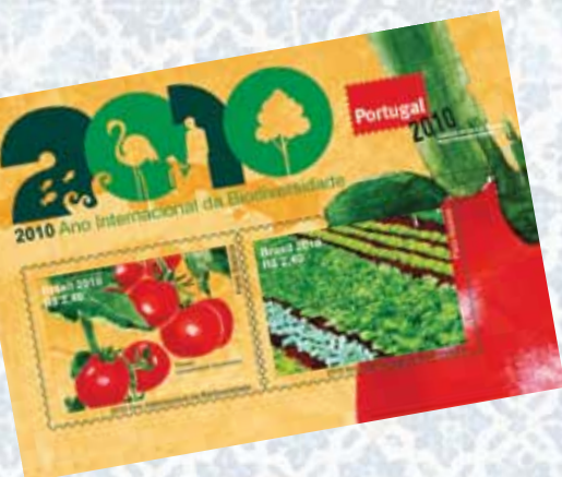
As emissões brasileiras destacadas na Portugal 2010.