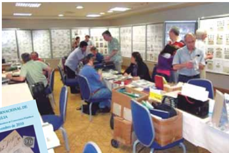
Comerciantes expõem seus produtos durante o Encontro.

A Associação Brasileira de Comerciantes Filatélicos (ABCF), com o apoio dos Correios e da Sociedade Philatélica Paulista (SPP), promoveu, em São Paulo, nos dias 19 e 20/11/10, o 7º Encontro Internacional de Filatelia. Foram colocados à mostra 20 painéis, além de um estande dos Correios e 36 mesas destinadas aos comerciantes do Brasil, da Argentina e dos Estados Unidos.