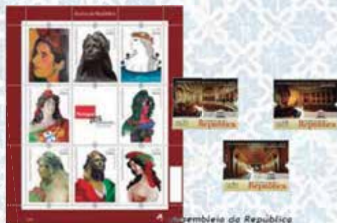
Bustos da República A segunda emissão de 2010