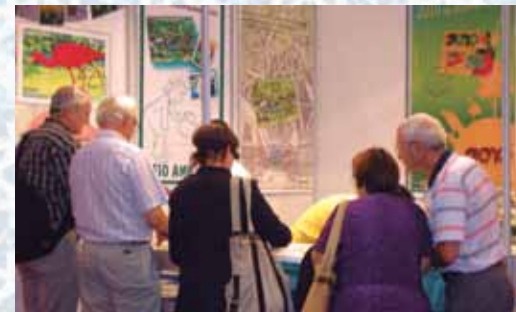
O estande dos Correios do Brasil na PORTUGAL 2010.