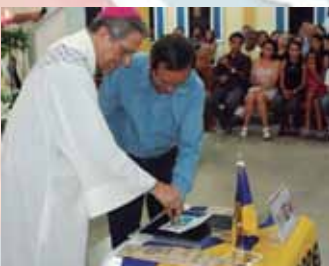
O lançamento do selo durante evento religioso.