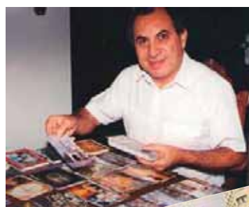
A evolução histórica da cidade de São Paulo nos postais de Daltozo.

Na coleção “Imagens urbanas: a verticalização de São Paulo”, Daltozo percorreu sobre a evolução vertical da cidade mais populosa da América do Sul. Com interessantes obras publicadas sobre cartofilia e um acervo que inclui mais de 160 mil cartões-postais, não por acaso, Daltozo costuma frequentar vez por outra as páginas da Revista COFI. ■