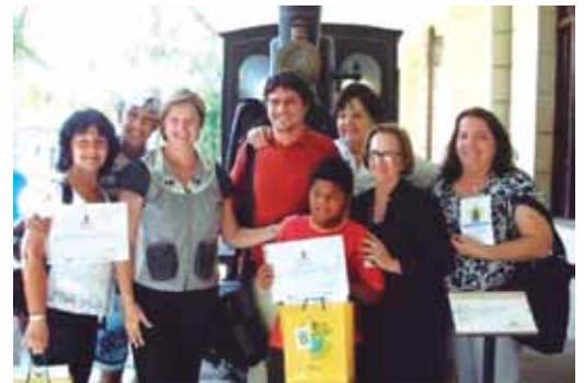
Premiação dos vencedores do concurso.

SBN, Q.1, Bloco A, 12º andar Ed Sede da ECT 70002-900 Brasília/DF revistacofi@correios.com.br