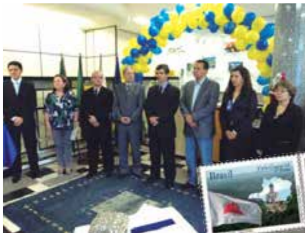
Autoridades presentes na inauguração da Agência Filatélica de Uberlândia.