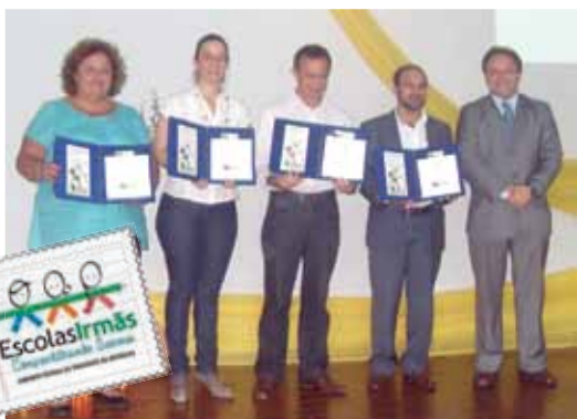
Exibição das peças filatélicas lançadas.

Desejo de saber, busca por cultura e arte. É a partir dessa premissa que foi criado o projeto “Escolas Irmãs”. Implantado em 2003 como uma extensão do “Fome Zero”, programa do governo federal que visa acabar com a fome no Brasil, parte do seguinte princípio: quem tem necessidade do pão também precisa saciar o apetite cultural e a busca pelo conhecimento. Os pilares do programa são solidariedade e intercâmbio onde profissionais da educação, pais, alunos e comunidade escolar como um todo são envolvidos de forma solidária em ações compartilhadas entre duas ou mais escolas.