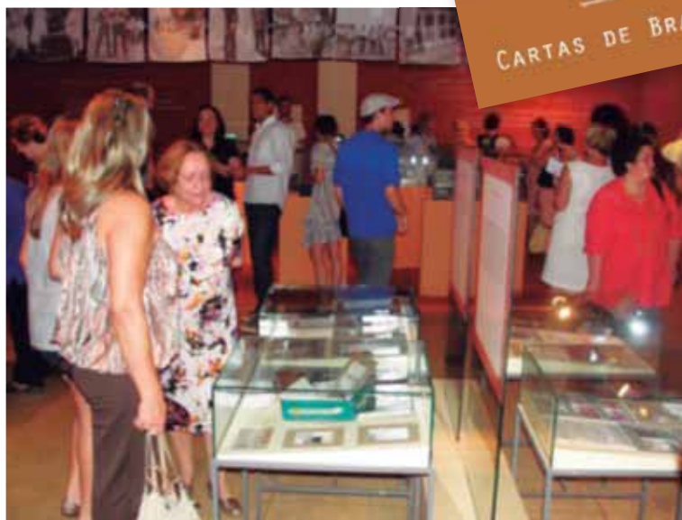
Um passeio entre as vitrines da exposição.

A exposição, formada por dois núcleos – um com cartas e outros documentos e o outro com áudio de entrevistas realizadas com destinatários ou remetentes –, fez da interatividade um dos pontos de destaque: os visitantes puderam deixar cartas para Brasília, guardadas em uma arca a ser aberta na comemoração dos 100 anos da cidade, em 2060.