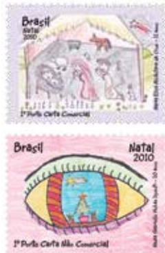
Emissão Comemorativa - Natal 2010