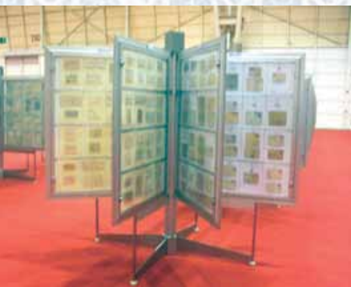
O painel expositor de 16 faces utilizado na exposição.