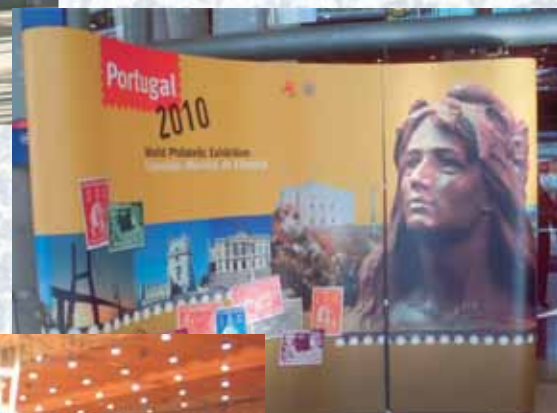
Painel na entrada do Pavilhão.