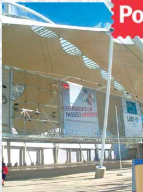
Entrada do Pavilhão da FIL.

Dentre administrações postais, comerciantes filatélicos, associações e federações de Filatelia, a PORTUGAL 2010 contou com a participação de 27 países, dentre os quais o Brasil, representado pela Federação Brasileira de Filatelia (FEBRAF), por filatelistas que concorreram individualmente nas diversas classes competitivas (ver relação dos premiados na tabela abaixo) e por profissionais da ECT.