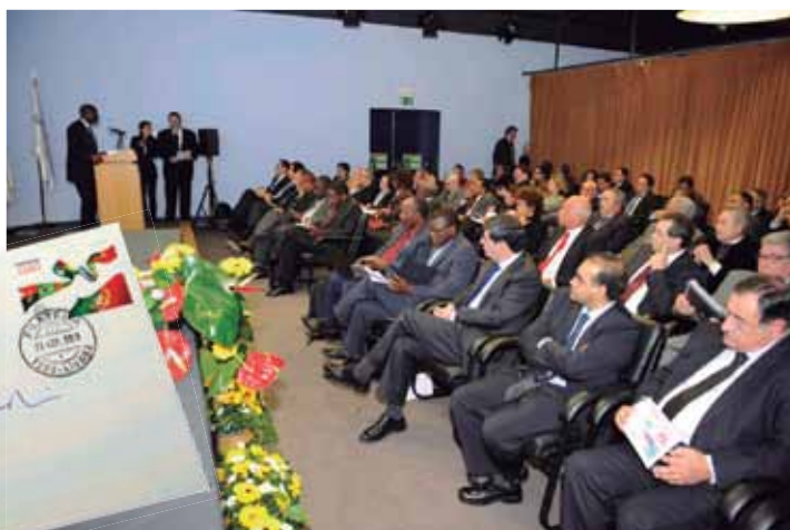
Representantes da AICEP durante a homenagem à entidade.