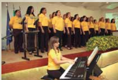
Coral dos Correios.