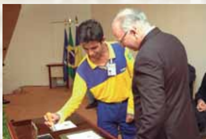
O Carteiro Nota 10 efetua a obliteração.

No dia 9 de outubro de 1874, há exatos 136 anos, era criada a União Postal Universal (UPU), órgão internacional que reúne os Correios de 191 países, e que regulamenta a atividade postal em todo o mundo. A partir de resolução do Congresso de Hamburgo, de 1984, a entidade definiu que a data de sua criação também passaria a ser o Dia Mundial dos Correios.