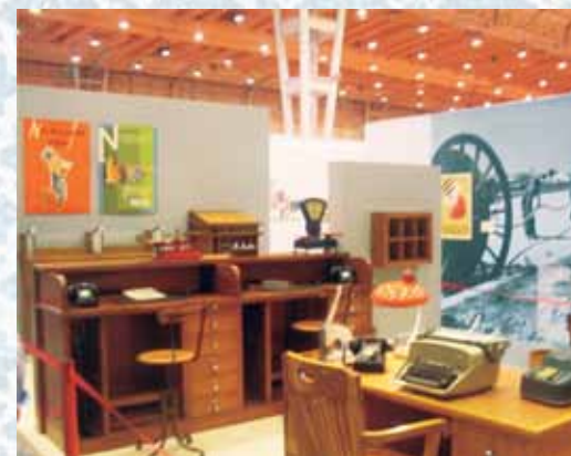
Uma viagem no tempo com a história dos Correios de Portugal.