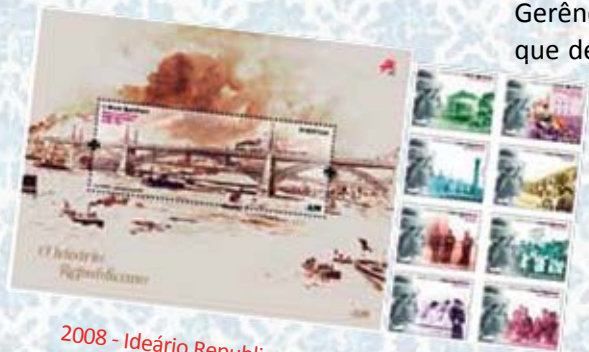
2008 - Ideário Republicano.