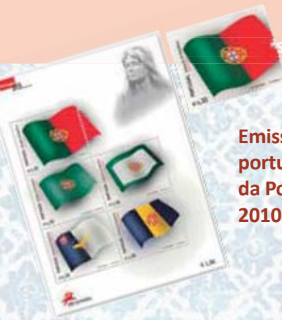
Emissões portuguesas da Portugal 2010