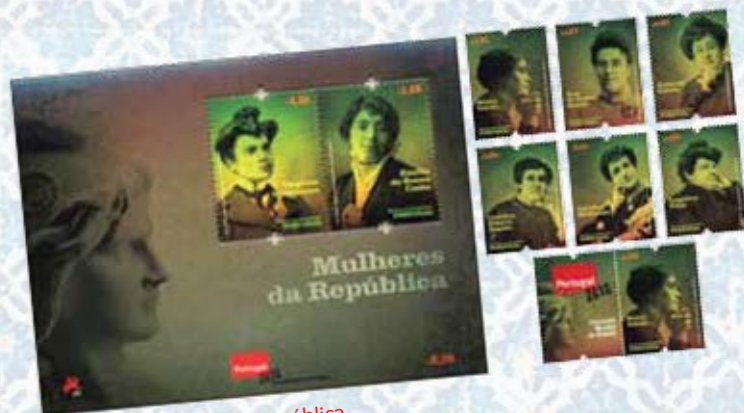
2009 - As Mulheres da República.