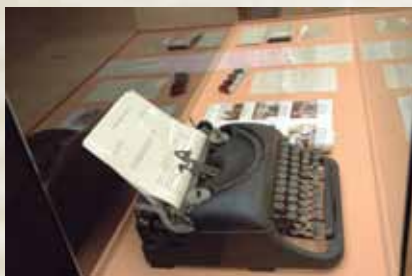
Detalhe da Exposição "Cartas de Brasília".