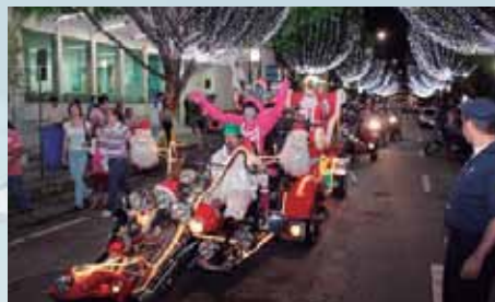
Papai Noel percorreu de moto as ruas da cidade.