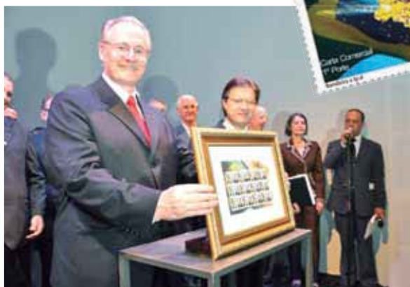
Governador Orlando Pessuti exhibe orgulhoso um quadro com a folha de selos.

Está localizado na capital, Curitiba, no Centro Cívico, e, desde 2007, estava em reforma até que, em 18/12/10, nas festividades de 157 anos da emancipação política do Paraná, o prédio voltou a sediar o executivo do Estado. Na mesma data, foram lançados selo personalizado e carimbo comemorativo da reinauguração do Palácio.