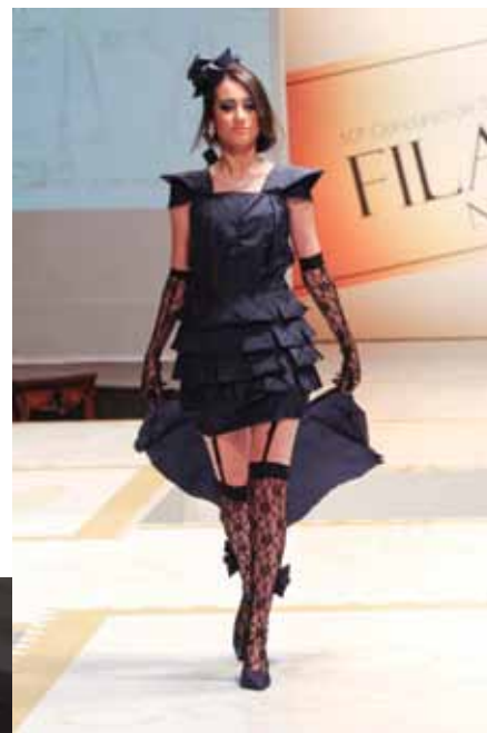
Modelo desfila com vestido tendo envelopes como motivo.