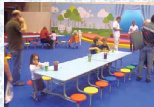
O espaço especial destinado às crianças.