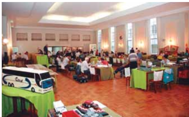
Visão geral do 7º Encontro Nacional de Filatelia, Numismática e Colecionismo de Taquara no Clube Comercial.

Dois dias de evento (15 e 16/10/10) e mais de 500 participantes: assim foi o 7º Encontro de Filatelia, Numismática e Colecionismo da cidade gaúcha de Taquara. A presença de diversos expositores, ampliou o apelo popular do encontro. Além de estimular a prática da Filatelia, o evento se tornou uma espécie de meca do multicoleccionismo, reunindo as coleções mais diversas: lápis de madeira, tampinhas de garrafa dos times de basquete dos Estados Unidos, bandeiras do Rio Grande do Sul ou miniaturas de locomotivas, ônibus e aviões.