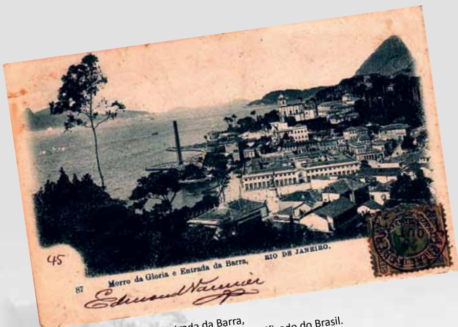
Morro da Glória e Entrada da Barra, Rio de Janeiro - 1º Máximo Postal Identificado do Brasil.