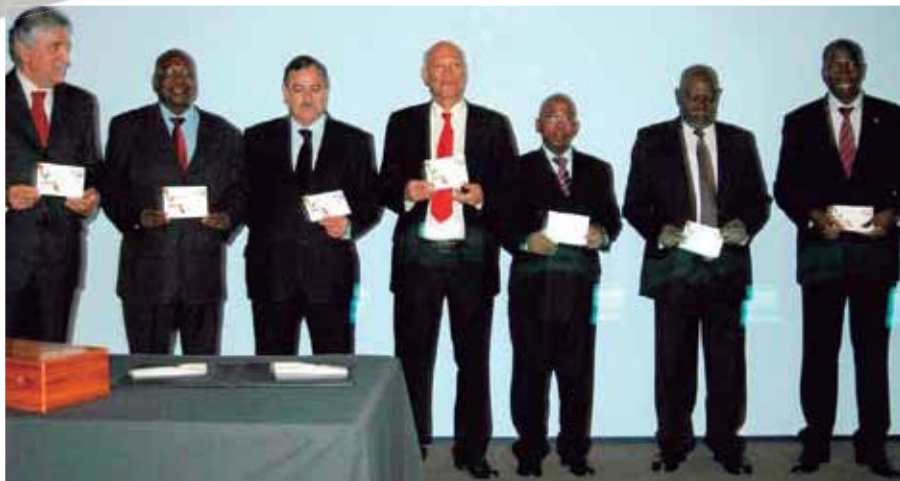
Os participantes do evento exibem as peças obliteradas.