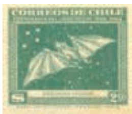
Chile, 6/12/1948, Sturnia lilius alimenta-se de frutas