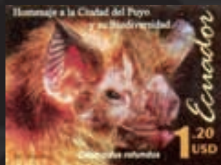
Equador, 12/2/2006 Desmodus rotundus "OVampiro" alimenta-se de sangue