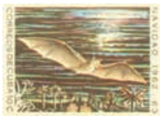
Cuba, 21/12/1962, Monophyllus redmani cubanus alimenta-se pólen, nectar e partes de flores.