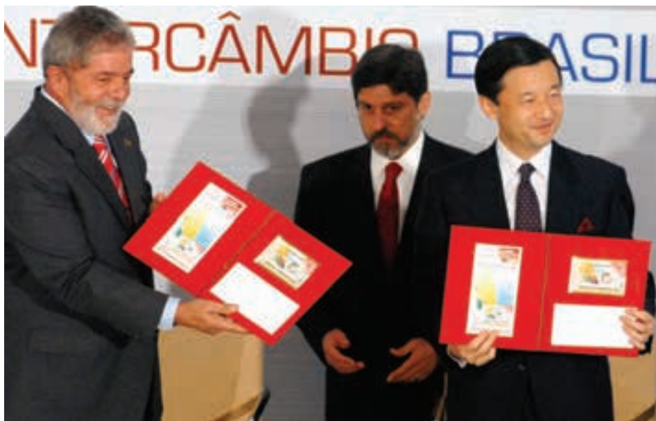
Presidente Lula e o príncipe herdeiro do Japão, Naruhito, durante a cerimônia de lançamento do selo Centenário da Imigração Japonesa no Brasil

é hoje uma dos maiores estimuladoras da prática, reunindo vendas on-line, leilões e sites de relacionamento, como o do Orkut, em que existem diversas comunidades para filatelistas, a maior delas com cerca de 3.000 membros.