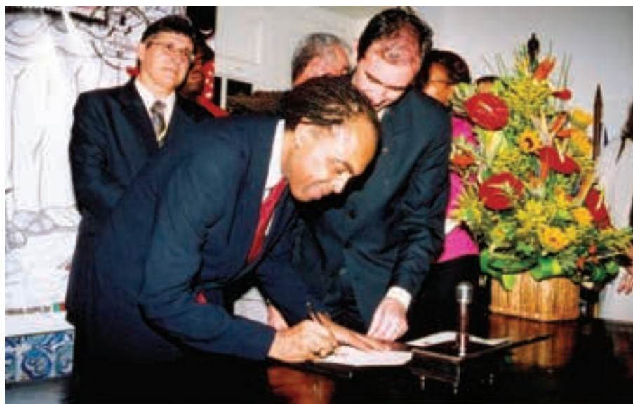
Ex-Ministro da Cultura, Gilberto Gil, oblitera selo do Tambor de Crioula, em agosto deste ano.

Mas, se o selo é cada vez mais interessante para quem o coleciona ou revende, também gera retorno para