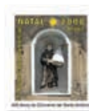
400 anos do Convento de Santo Antônio (RJ)