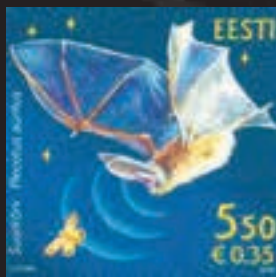
Estonia, 14/2/2008 Plecotus auritus alimenta-se de insetos

O Brasil emitiu o bloco, Cavernas Brasileiras, em cinco de junho de 1996, neste aparece a figura de um morcego que não é possível identificar. ■