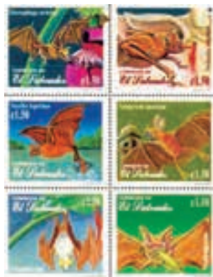
El Salvador Glossophaga soricina (pólen néctar); Desmodus Rotundus (sangue); Nyctilio leporinus (peixes); Vampyrum spectrum (pequenos vertebrados); Ectophylla alba (frutas); Myotis nigricans (insetos)