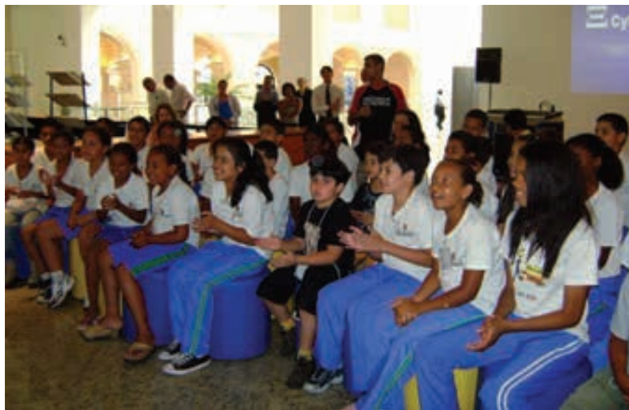
Imagem das Oficinas Filatélicas da Sulbrapex

Dos 142 expositores presentes à Sulbrapex 2008, 46 faziam sua estreia. Os grandes nomes da Filatelia nacional se fizeram presentes com suas coleções únicas e esmeradas, dentre as quais sobressaíram preciosidades como exemplares do Olho-de-Boi e o Penny Black, o primeiro selo do mundo. Chamou à atenção do corpo de jurados a alta qualidade do conjunto das coleções em relação às últimas edições do evento. Por essa razão metade dos que receberam prêmios foram contemplados com medalhas de ouro, vermeil grande e vermeil . ■