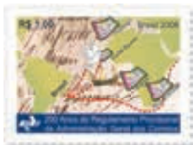
200 anos do Regulamento Provisional da Administração Geral dos Correios