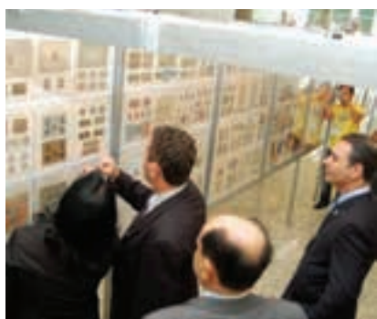
Abertura da Exposição Sulbrapex