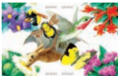
USA, 18/10/2006 – Leptonycteris yerbabuena alimenta-se de pólen, nectar