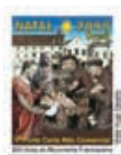
800 anos do Movimento Franciscano