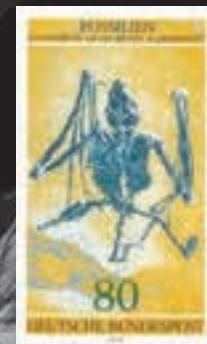
Alemanha 13/7/1978 Palaeochiropteryx tupaïdon