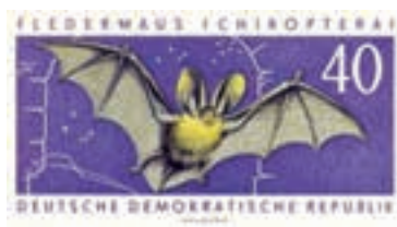
D.D.R., 16/02/1962 – Plecotus auritus alimenta-se de insetos